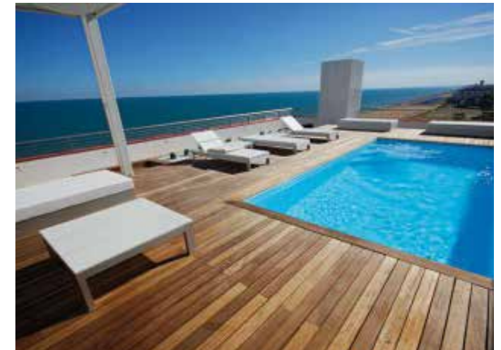
Decking Kolam Renang