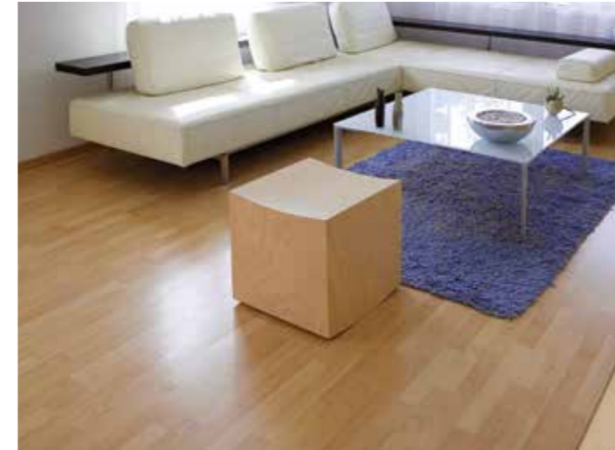
Ruang Tamu / Ruang Keluarga

Sikabond®-T55 (J) Cocok Untuk Di Area-Area Tertentu Seperti: