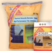
Sika TileFix-200 TA ini tersedia dalam kemasan 5 kg, 25 kg.