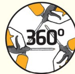
Aplikasi SikaHyflex® 220 Window