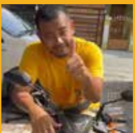
Derry , Medan.

Saya pakai SikaMur 130 ThinBed untuk renovasi, ada kode unik di dalam kemasan lalu saya kirim aja sesuai format, Alhamdulillah saya dapat motor pas banget dapat pas bulan Puasa, bisa dipakai buat lebaran, Terima kasih Sika Indonesia.