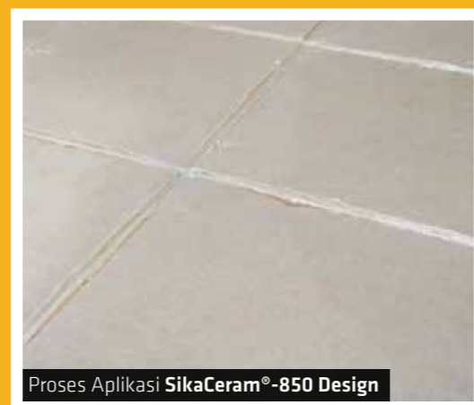
Proses Aplikasi SikaCeram®-850 Design