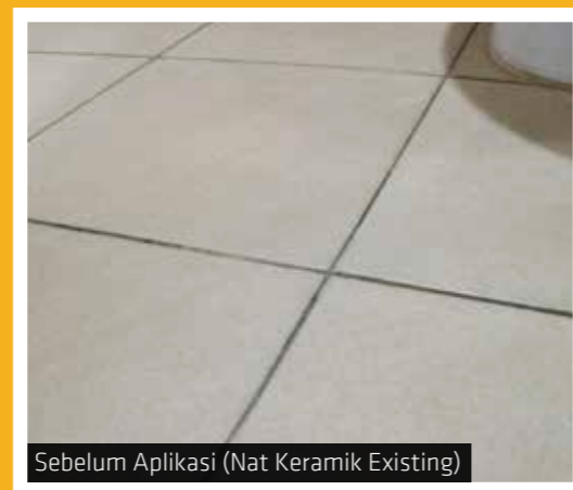
Sebelum Aplikasi (Nat Keramik Existing)

Gambar Sebelum dan Sesudah Aplikasi SikaCeram®-850 Design Resin Epoxy Tile Grout pada nat lantai kamar mandi rumahrosa