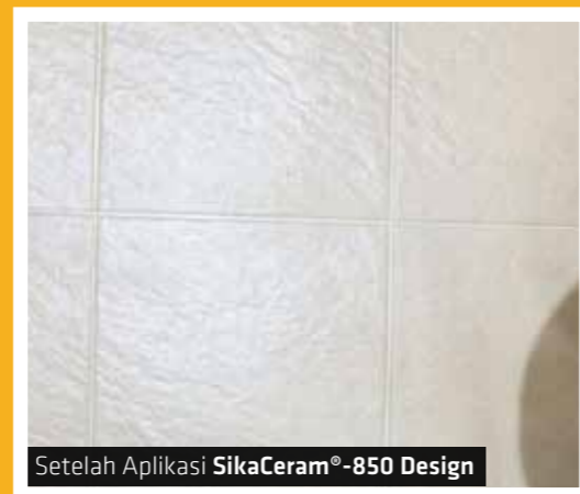
Setelah Aplikasi SikaCeram®-850 Design