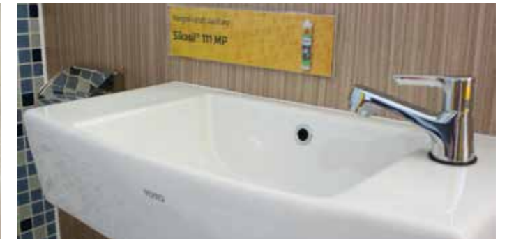
WET ROOM SOLUTIONS