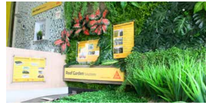
ROOF GARDEN SOLUTIONS